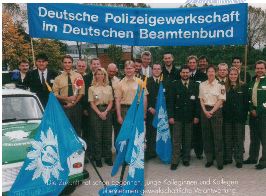
Die Zukunft hat schon begonnen. Junge Kolleginnen und Kollegen übernehmen gewerkschaftliche Verantwortung.