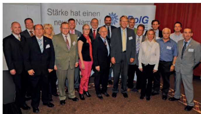
Erster Vorstand der DPoIG Bundespolizeigewerkschaft

Im Vorwege der ersten Reform des Bundesgrenzschutzes 1992 setzt sich der DPoIG Fachverband Bundespolizei dann aktiv und erfolgreich für die Übernahme der Aufgaben der Bahnpolizei ein. Beschäftigten der ehemaligen Bahnpolizei und des Fahndungsdienstes entscheiden sich zu großen Teilen zu einem Übergang von der Deutschen Bahn zum Bundesgrenzschutz. Gewerkschaftspolitisch steht für die Beschäftigten der Bahnpolizei auch die Entscheidung zum Wechsel der Gewerkschaft innerhalb des dbb an. Alle vertretenen Gewerkschaften bekommen die Gelegenheit sich dem Bundesvorstand des Fachbereichs Bahnpolizei in der GDBA vorzustellen. Im Ergebnis empfiehlt die GDBA den Übergang ihrer Mitglieder in den DPoIG Fachverband Bundespolizei. Die Jahre 1992 und 1993 haben ihren Schwerpunkt in der bundesweiten Organisation von Kollegen der Bahnpoli-